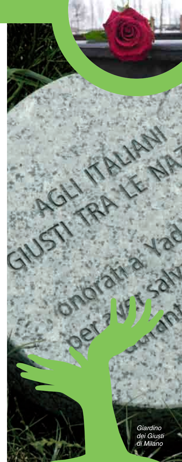
Giardino dei Giusti di Milano