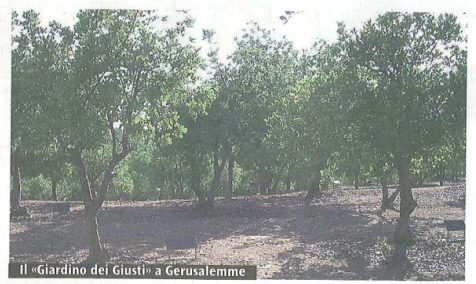
Il «Giardino dei Giusti» a Gerusalemme